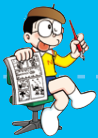
カートゥーニスト cartoonist まんが家