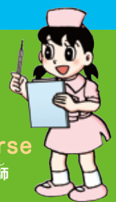
ナース nurse 看護師